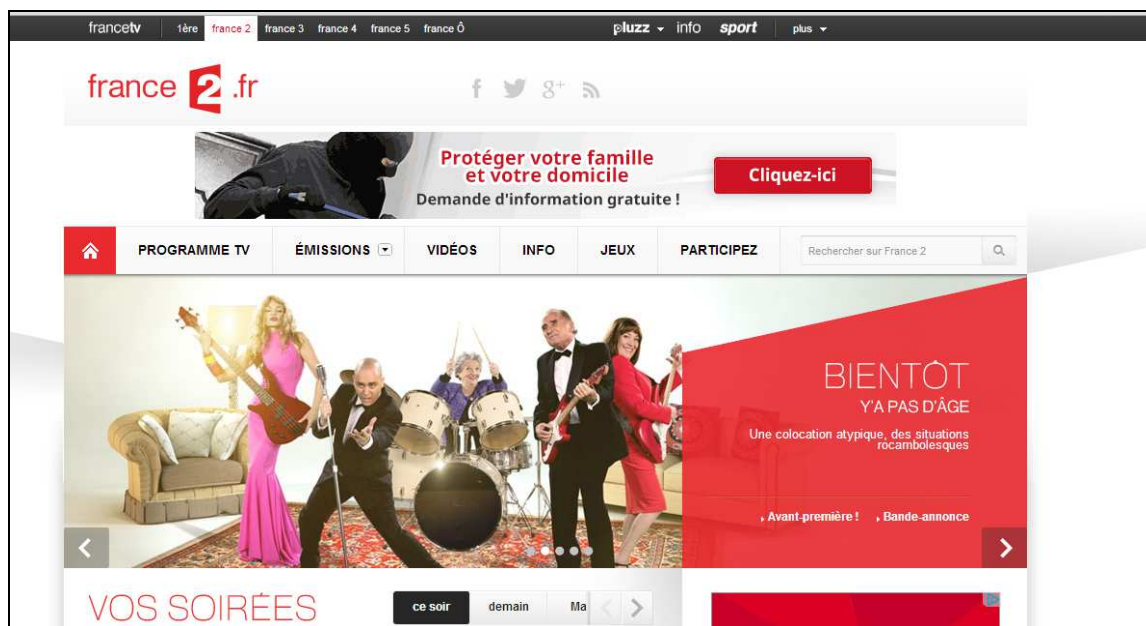
Image 1 – Capture d'écran du haut de la page d'accueil sur site Internet de France 2, 25/08/13.

Le second bandeau met en valeur le logo de la chaîne, ainsi que ceux des réseaux socio-numériques les plus emblématiques : Facebook, Twitter, Google+.